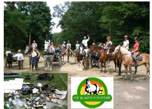
Rando-écolo « Riding Against Pollution »

Avec le CRTEIF, participez à une randonnée dans la Drôme, traversée du Vercors et à l'Equirando de Vizille