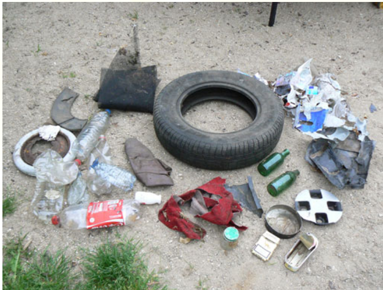
Collecte du 25 Avril 09