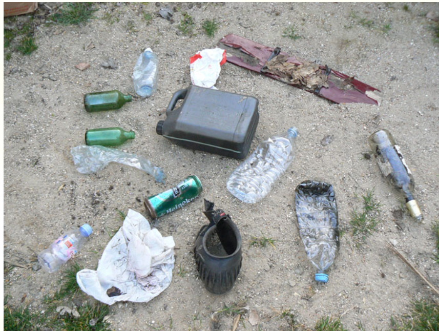
Collecte du 14 Mars 09