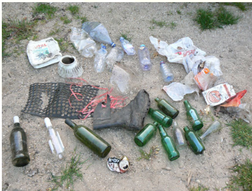
Collecte du 4 Avril 09